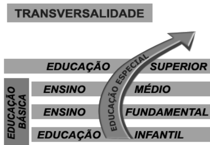
Figura 2. Educação Especial como parte integrante do Sistema Educacional Brasileiro

De acordo com a Resolução CNE/CEB N°2/2001, o quadro a seguir ilustra como se deve entender e ofertar os serviços de educação especial, como parte integrante do sistema educacional brasileiro, em todos os níveis de educação e ensino :